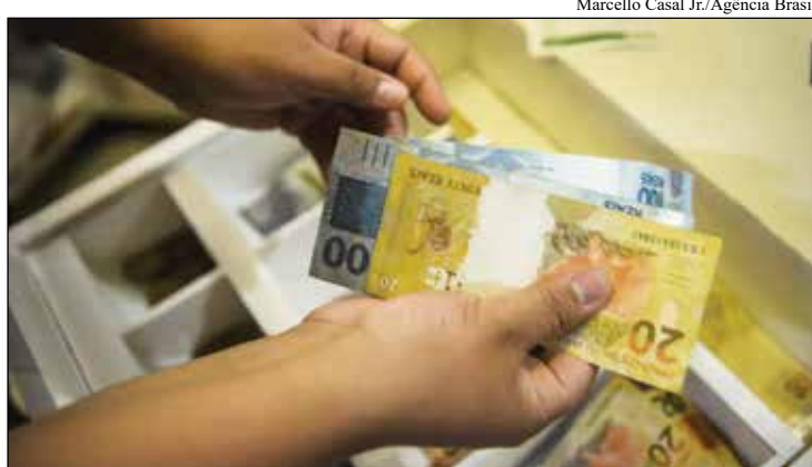
Marcello Casal Jr./Agência Brasil

O reajuste segue a projeção de 3,06% para o Índice Nacional de Preços ao Consumidor (INPC) para os 12 meses terminados em novembro mais o crescimento da economia em 2025, limitado ao crescimento de gastos de 2,5% acima da inflação, determi-